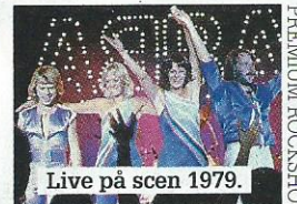
Live på scen 1979.

❖ Den 7 maj öppnar ABBA The Museum på Djurgården i Stockholm. Många av utställningarna är interaktiva och som besökare får man uppleva hur det skulle kännas att vara den femte medlemmen i ABBA eller gå in i Polarstudion. Under högsäsong kommer museet att vara öppet mellan klockan 10 och 20. Biljetter kostar 195 kronor för vuxna och barn under 8 år betalar 50 kronor.